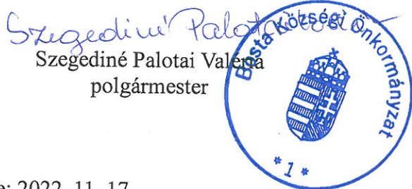
Szegediné Palotai Valéria polgármester

Ez a rendelet a kihirdetését követő napon lép hatályba.